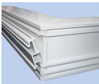
Inserisci il connettore.