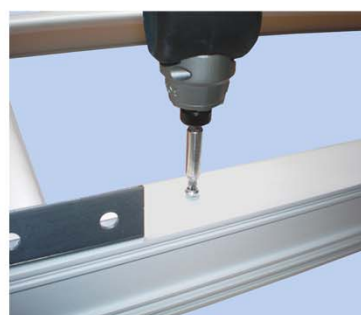
Inserisci le viti autofilettanti.