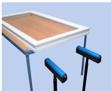
Posiziona il telaio sul tavolo.