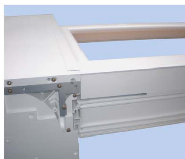
L'elemento è pronto per utilizzo.