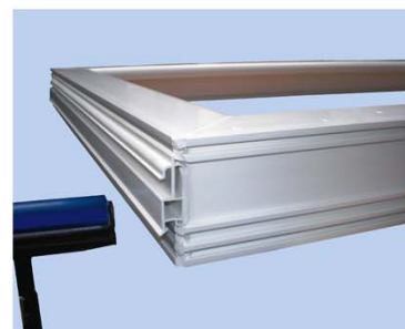
Premi il connettore.