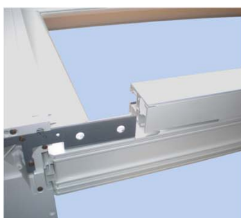
Aggancia il binario della guida.