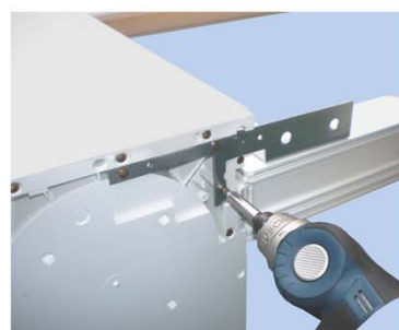
Avvita la staffa.