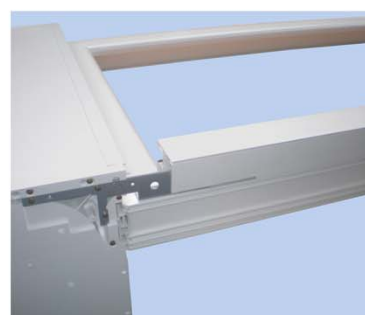
Fai scorrere la guida sotto il cassonetto della tapparella.