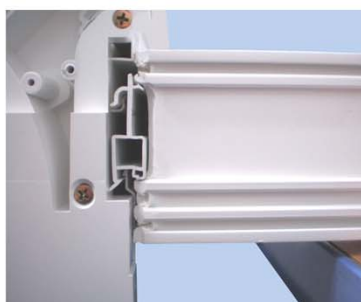
Spingi il connettore del telaio dentro il profilo di base.