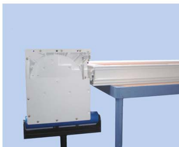
Nettere il cassonetto della tapparella. Sui cavalletti.