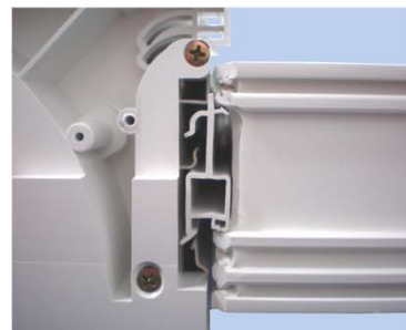
Blendrahmen in Basisprofil einführen