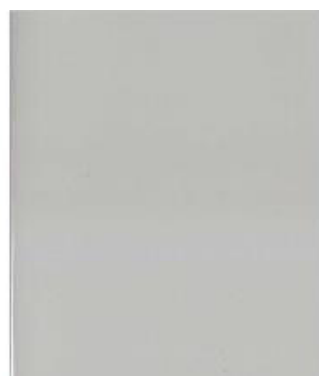
Achatgrau - RAL 7038 7038.05