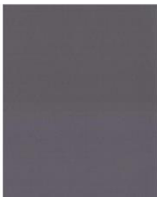
Basaltgrau - RAL 7012 7012.05