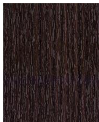
Eiche dunkel 3.1670.04