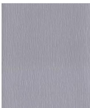
Silbergrau - RAL 7001 7155.05