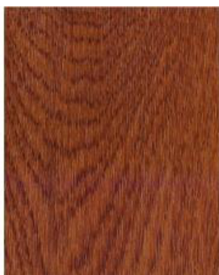
Golden Oak 49158