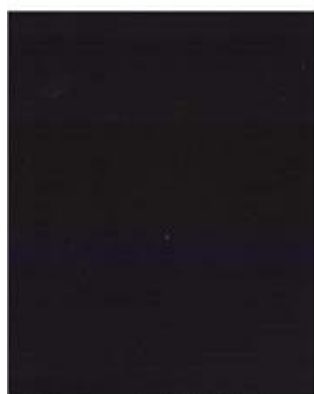
Schwarzgrau - RAL 7021 7021.05