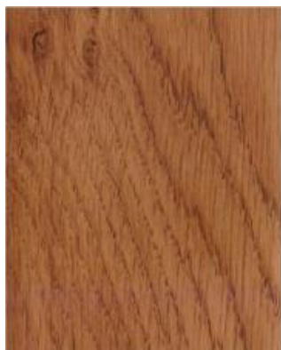
Winchester XA 49240

PLEASE NOTE: The presented colours are for illustrative purposes only and may significantly differ from the actual window colour.