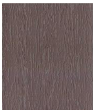
Quarzgrau - RAL 7039 1.7039.05