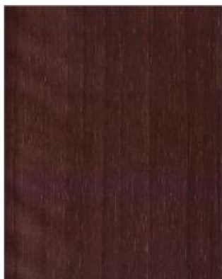
Siena Noce 49237