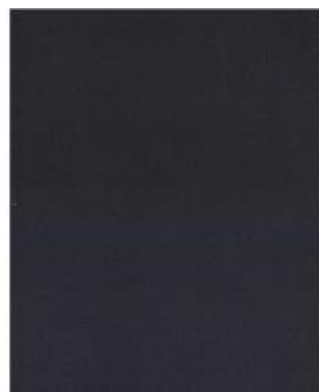
Anthrazitgrau - RAL 7016 436-7003