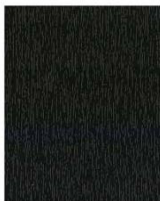
Tannengrün - RAL 6009 F 436-5021