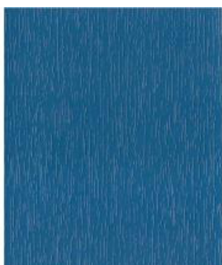
Brillantblau - RAL 5007 5007.05