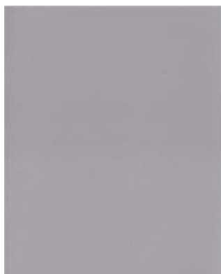
Signalgrau - RAL 7004 7004.05