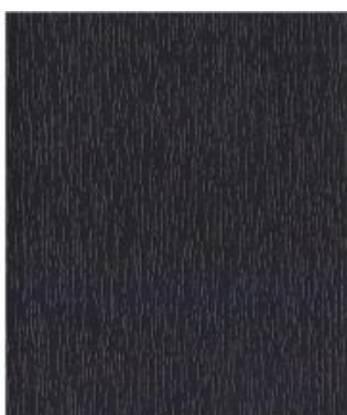
Anthrazitgrau - RAL 7016 436-5003