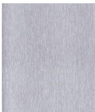
Aluminium gebürstet 436-1001