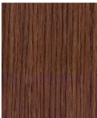
Eiche hell 3.1670.02