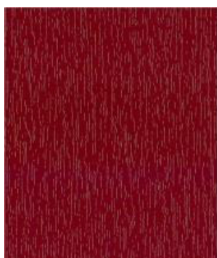
Rot - RAL 3011 3081.05