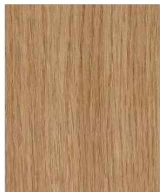
Eiche natur 3.1670.11