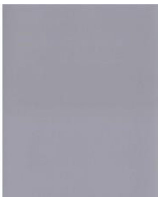
Silbergrau - RAL 7001 7155.05