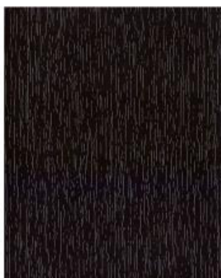
Braun Dekor 8518.05