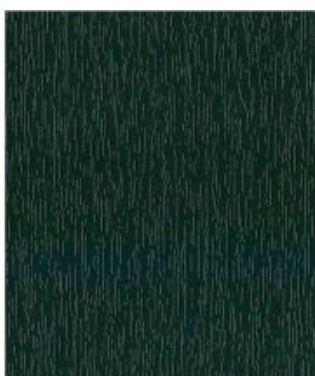
Moosgrün - RAL 6005 6005.05