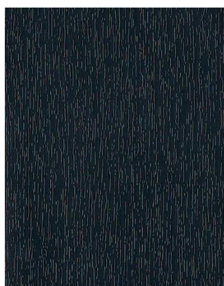
Anthrazitgrau - RAL 7016 436-5003