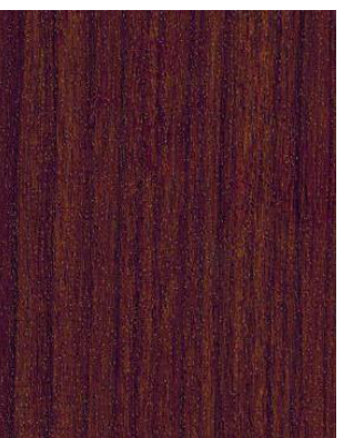
Macore 9.3162 002-116700