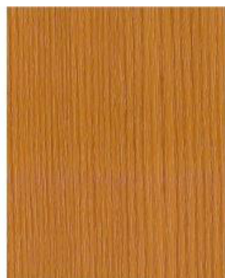
Oregon 4 1.1920.01