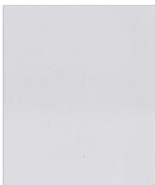
Lichtgrau - RAL 7035 7251.05