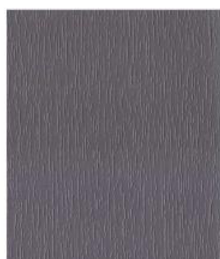
Basaltgrau - RAL 7012 7012.05