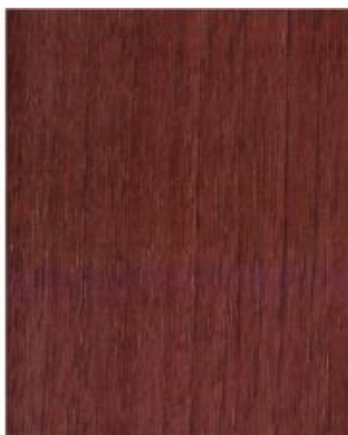
Siena Rosso 49233